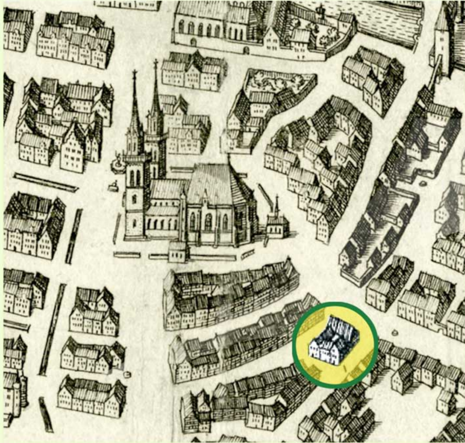
Lorenzer Viertel 1648, Kupferstich (Ausschnitt), Matthäus Merian d. Ä., Vater der Merianin

Das Anwesen Lorenzer Platz 4 im grünen Kreis gehörte schon 1520 einem Bierbrauer. Im siebzehnten Jahrhundert braute hier die Familie „Köchert“, auch „Keget“ geschrieben. Die Braustätte war bis 1925 in Betrieb. Heute gehört das Areal zur Zentrale der Sparkasse Nürnberg.