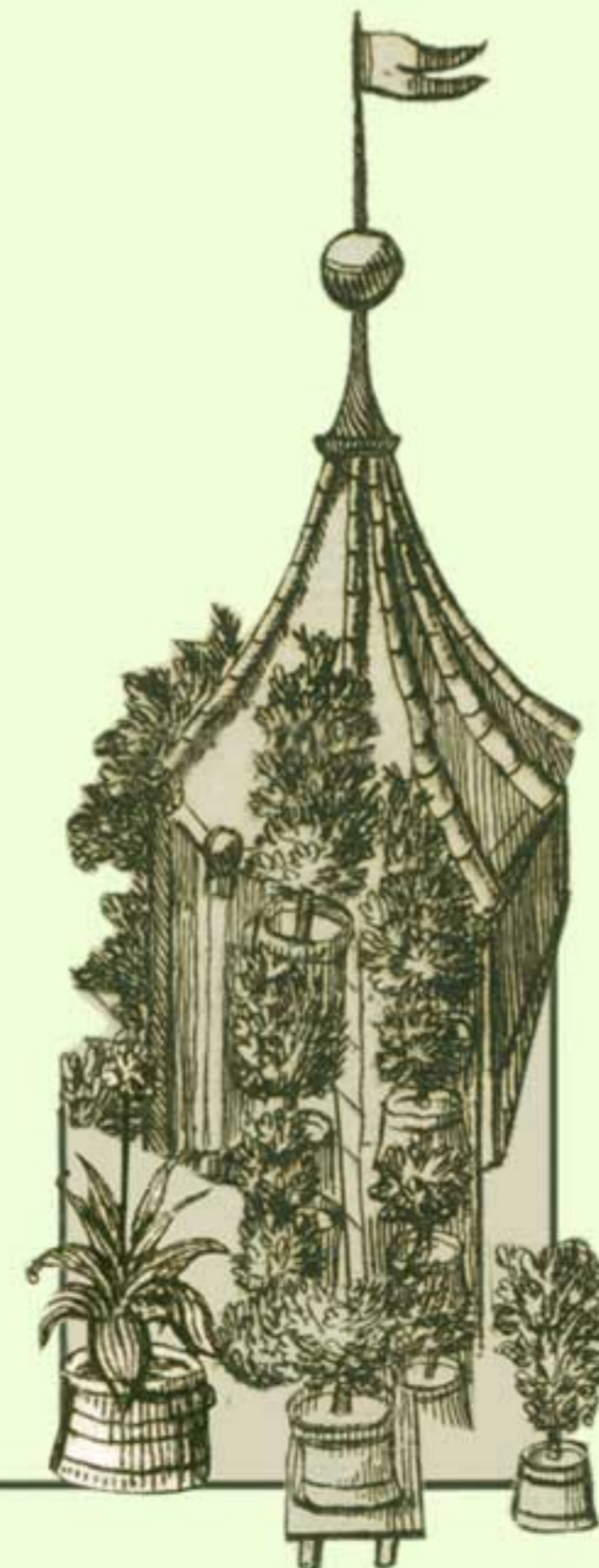
Dachgarten im alten Nürnberg um 1680, Kupferstich, unbekannter Künstler; Museen der Stadt Nürnberg